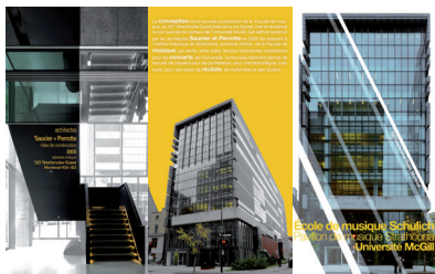
Isabelle Baillargeon : ÉCOLE DE MUSIQUE DE L'UNIVERSITÉ MCGILL - Projet de photographies et de design de brochure à partir d'une oeuvre d'architecture